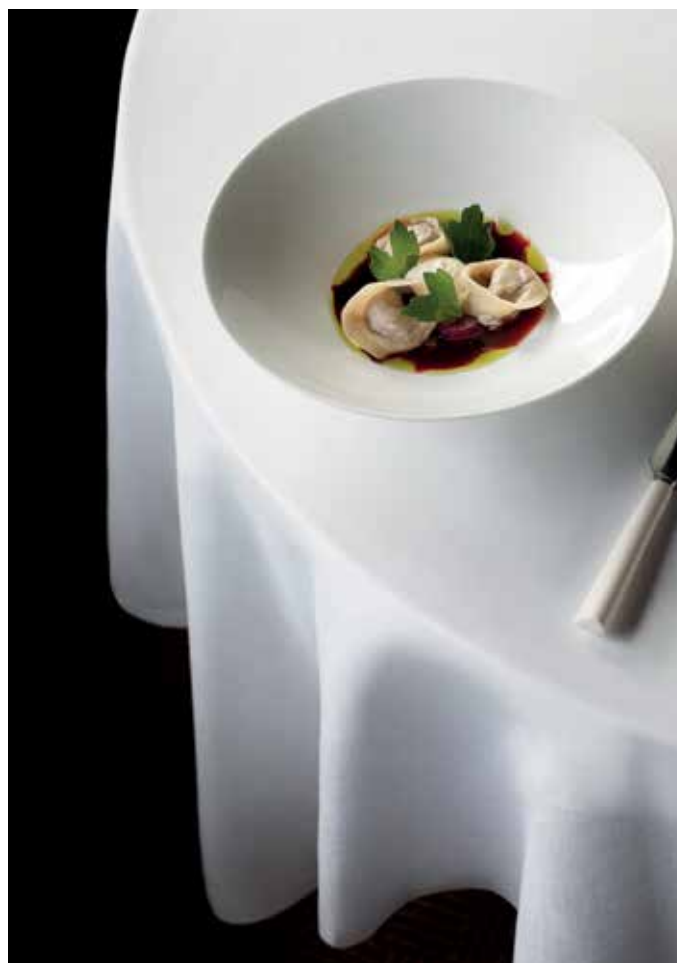
Tradition och innovation: Savoys vorschmackpelmenier med rödbetsbuljong.