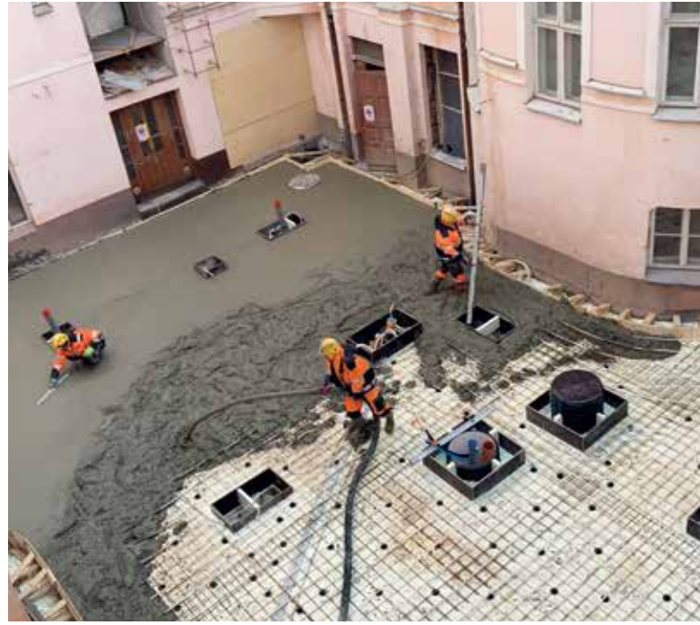
Inte mindre än 60 kubikmeter betong lades över Gilllets gård.

badrumskakel saknades fortfarande. På bryggan som förbinder Gillegården med Hotel F6 vid Fabiansgatan återstod endast den sista finslipningen.