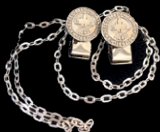
Servettkedja 25 euro