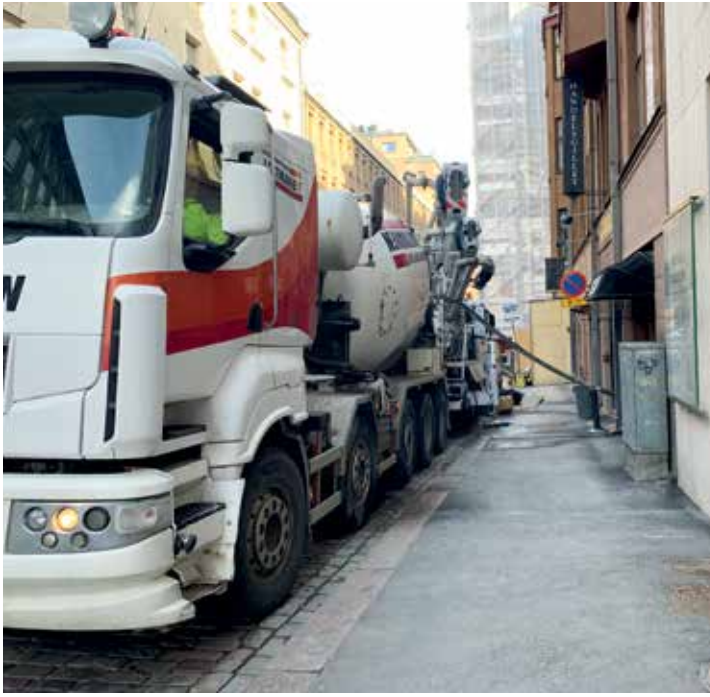
Fem bilar levererade betongen.