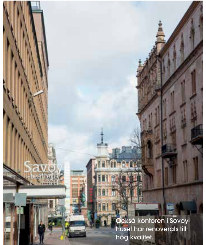
Också kontoren i Sovoy-huset har renoverats till hög kvalitet.