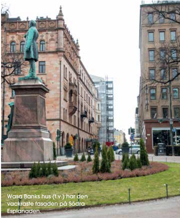
Wasa Banks hus (t.v.) har den vackraste fasaden på Södra Esplanaden.