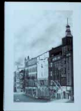
Kondoleans- och gratulationsadresser à 15 euro.