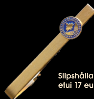
Slipshållare + etui 17 euro.