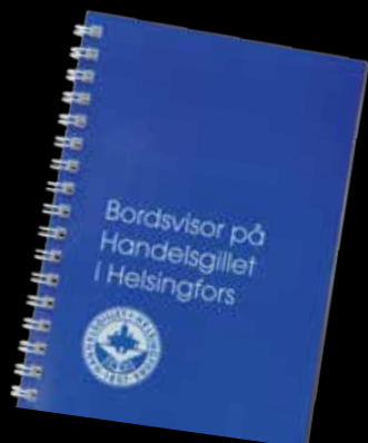
Bordsvisor på Handelsgillet, 20 euro.

I Gilleshoppen kan du köpa bästsäljaren Bordsvisor på Handelsgillet, Handelsgilletts manschettknappar och slipshållare samt kondoleans- och gratulationsadresser.