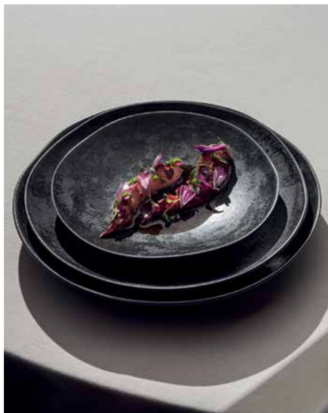
Modern klassiker: Kokt hummer på Palace.